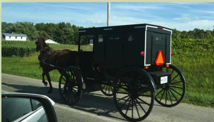
Buggy amish sur sa voie privée