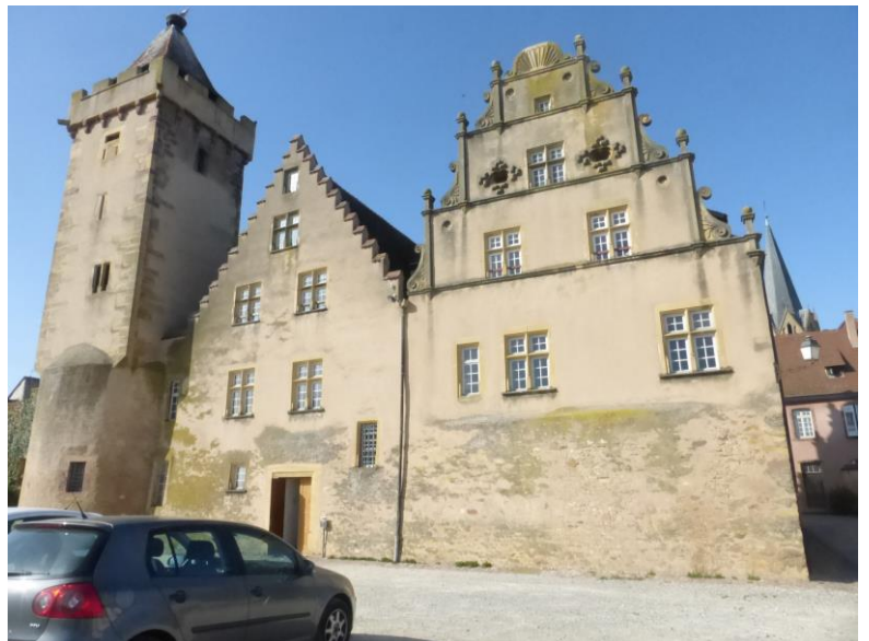
Hôtel de ville où se réunissait le Rath et la « tour des sorcières » qui furent très nombreuses à être brûlées autour de 1616.

Avec la Révolution, la ville de capitale administrative du prestigieux Haut Mundat est soudain réduite au rôle de simple chef-lieu de canton. Toutefois elle est connue par son grand hôpital psychiatrique créé au début du XX ème siècle et une école d'agriculture.